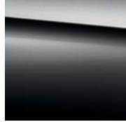
197 obsidian black