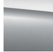
799 designo diamond white bright*