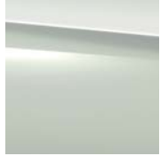
149 polar white