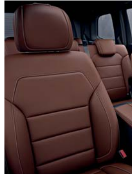
224 saddle brown/black