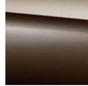
796 citrine brown