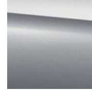
988 diamond silver