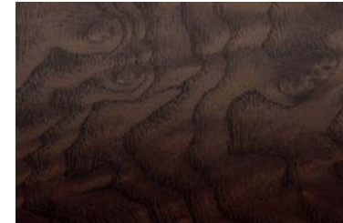
H09 brown open-pore ash wood