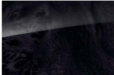
729 high-gloss black poplar wood