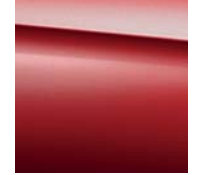
996 designo hyacinth red metallic*