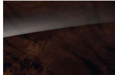
731 high-gloss brown burr walnut wood