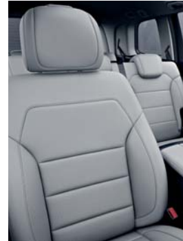
228 crystal grey/black