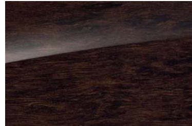
734 high-gloss brown eucalyptus wood